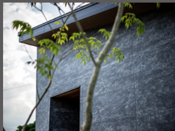
窓の少ない外観×プライベート空間

洗礼された動線、スッキリまとめた収納スペース、 家族のライフスタイルに合わせた平屋。