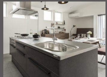
モノトーンの機能的なキッチン