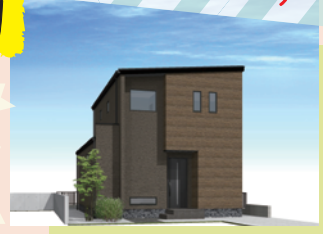
※画像は一部イメージです。