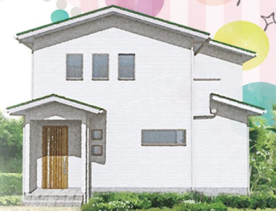
※こちらの外観は完成予想パースです。