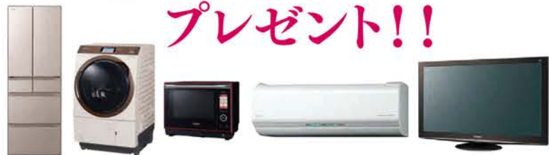
※家電製品は当社指定のものになります。詳細はスタッフにお尋ねください。※掲載の写真はイメージです。