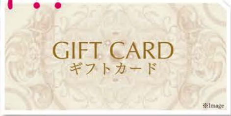
※数に限りがございます。お早めにとどうぞ。※1家族につき1回とさせていただきます。