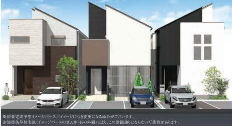
※街並み完成予想イメージ/イメージにつき変更になる場合がございます。 ※建築条件付宅地(イメージバスの真ん中・右の外観)により、この景観通りにならない可能性があります。

南東側に道路のある、 明るく開放的な住宅地が誕生します。 ウッドデッキ&吹抜けのある家 4,730万円 (販売予定価格/税込)