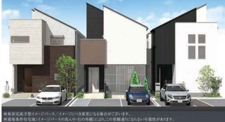
※街並み完成予想イメージベース/イメージにつき変更になる場合がございます。 ※建築条件付宅地(イメージベースの真ん中・右の外観)により、この景観通りにならない可能性があります。

南東側に道路のある、 明るく開放的な住宅地が誕生します。 ウッドデッキ&吹抜けのある家 4,730万円 (販売予定価格+税込)