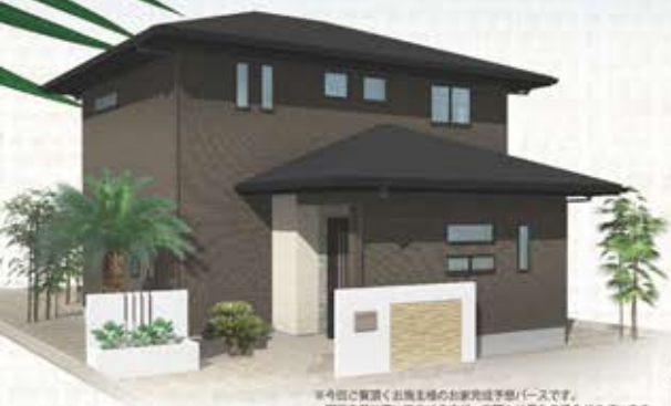
※今日起工予定の出発地のお家完成予想イメージです。図面を基に書いておりますが、実際とは異なる場合がございます。